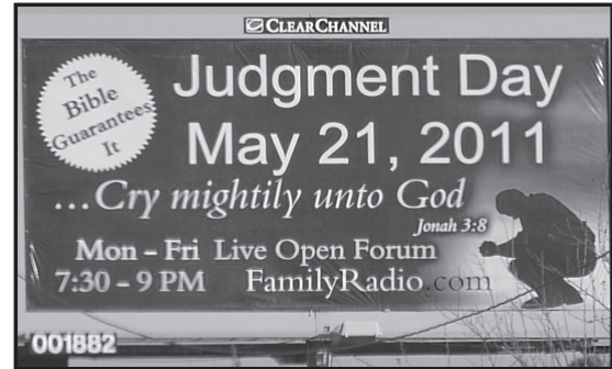
'Kehanetin Çöküşü' 3

-Yehova Şahitleri yayınları, Zaman Yaklaştı